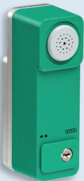
Exit-Controller NG Standard