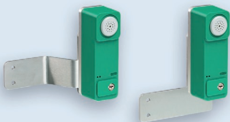
mit Montageplatte MPL R für Rohrrahmentüren